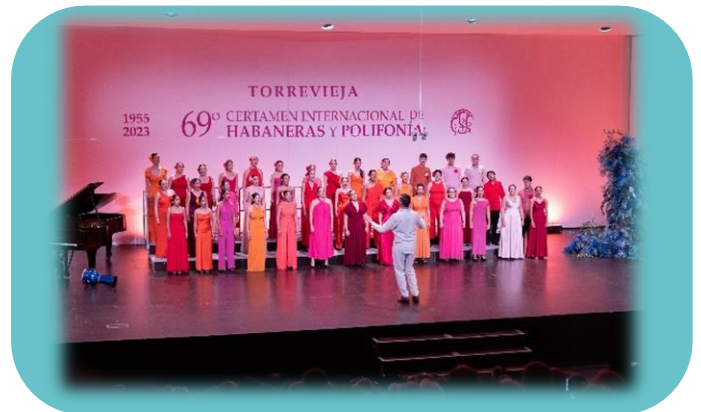
Coro Juvenil Las Veredas, Colmenarejo (Madrid). Categoría Juvenil.

El Coro Juvenil Las Veredas de Colmenarejo (Madrid) lleva diez años formando a niños y niñas, y jóvenes en el canto coral, fomentando su crecimiento musical y personal. Con una enseñanza vocal de calidad, el coro promueve la creatividad y el trabajo en equipo, convencido de que la música es una herramienta clave para el desarrollo intelectual, emocional y personal.