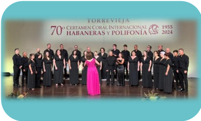
Coral Torrevejense Francisco Vallejos. Torrevieja (Alicante). Categoría Adulto.