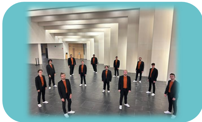
Cor Nomens. Valencia. Categoría Adulto.

Desde Valencia, el Cor Nomens nace en 2024 para renovar el canto coral masculino con una propuesta versátil y contemporánea. Formado por músicos con amplia experiencia, actúan sin director, lo que exige gran cohesión y trabajo colectivo. Buscan consolidarse como referencia con una interpretación expresiva. Afrontan su primera salida fuera de la Comunidad Valenciana con el objetivo de seguir creciendo y aportando nuevas perspectivas al panorama coral.