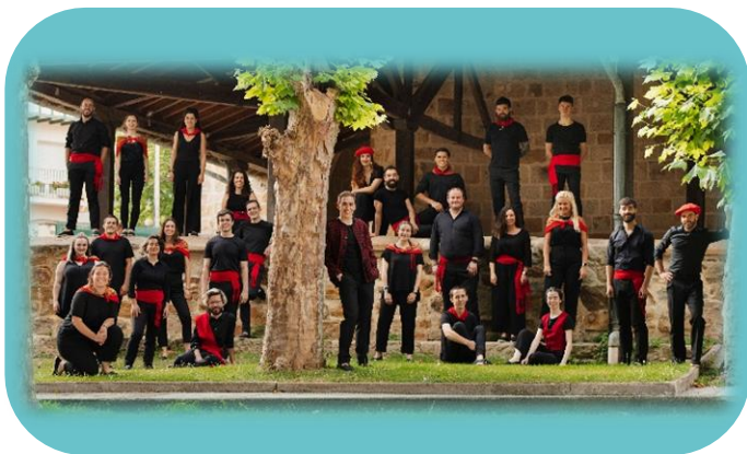
Akelarre Abesbatza, Bilbao. Categoría Adulto.

Akelarre Abesbatza, coro de cámara mixto del País Vasco, participará en el Certamen Coral de Ejea de los Caballeros. Fundado en 2018 y dirigido por Xabier M. Aretxabaleta, está formado por jóvenes de 19 a 29 años de Bilbao y Donostia. Su misión es promover la música coral y colaborar con jóvenes artistas, llevando su sello personal a este prestigioso certamen.