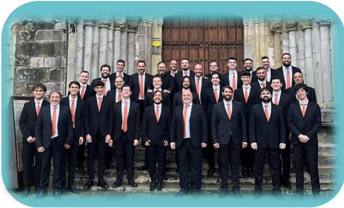
Coro Masculino Ferrum, Luanco (Asturias). Categoría Adulto.

El Coro Masculino Ferrum, parte del proyecto "El León de Oro", se fundó en 2019 pero se vio interrumpido por la pandemia. Renacido en 2024, busca enriquecer el repertorio coral de voces graves. En julio ganó el 2º premio en el Certamen de la Canción Marinera de San Vicente de la Barquera y participa en la inauguración de la temporada 2024/2025 del proyecto LDO.