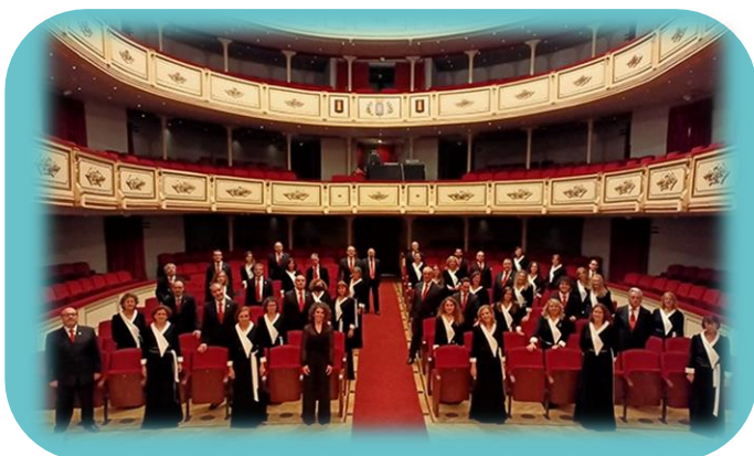
Sociedad Coral Orfeón Bungalés (Burgos). Categoría Adulto.