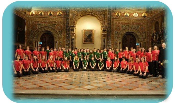
Coral del Conservatori de San Cugat (San Cugat del Vallés, Barcelona). Categoría Juvenil.