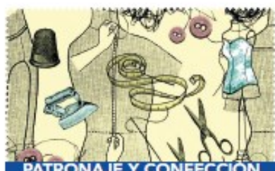
PATRONAJE Y CONFECCIÓN