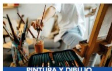
PINTURA Y DIBUJO