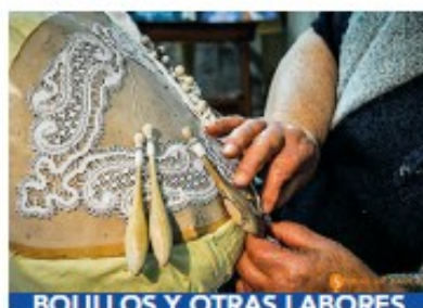
BOLILLOS Y OTRAS LABORES